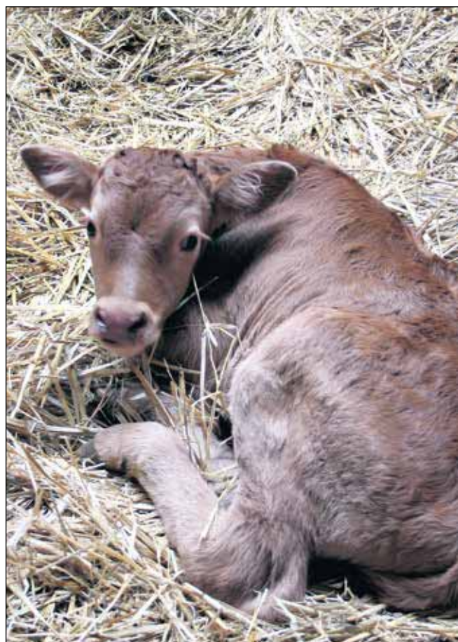
Siden maj 2015 har fem hold økologiske kalvepassere dystet om at sænke dødeligheden blandt deres kalve mest muligt.

Tirsdag d. 28. juni kl. 10 Brunbjergvej 1 7400 Herning